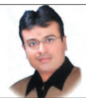
निखिल मट्ट (इन्वेस्टमेंट पॉइंट)

दिनांक 01.06.2026 को निपटी फ्यूचर बंद भाव @ 23459 पॉइंट :- आगामी संभावित निपटी फ्यूचर 23606 पॉइंट के प्रथम तथा 23676 पॉइंट के अति महत्वपूर्ण रेंजिस्टेंस जोन से ट्रेडिंग संदर्भ में 23373 पॉइंट से 23303 तथा 23272 पॉइंट के महत्वपूर्ण स्तर को स्पर्श करने की संभावना रखता है। निपटी फ्यूचर में 23272 पॉइंट के आसपास सावधानीपूर्वक पोजिशन बनानी चाहिए....!!! अब नजर डालते हैं फ्यूचर्स स्टॉक सम्बंधित मूवमेंट पर....!!!